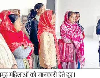
नारनौल। समूह महिलाओं को जानकारी देते हुए।