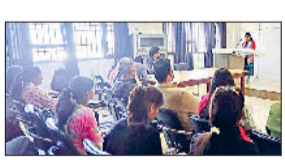
सतनाली मंडी। कॉलेज में आयोजित प्रतियोगिता में विचार रखती छात्रा।