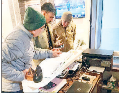
नारनौल। होटल के रजिस्ट्रार की जांच करते पुलिसकर्मी तथा चेकिंग अभियान चलाती डॉग स्कॉड टीम।