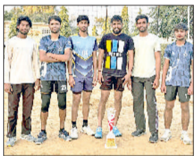
नारनौल। प्रतियोगिता के विजेता विद्यार्थी।