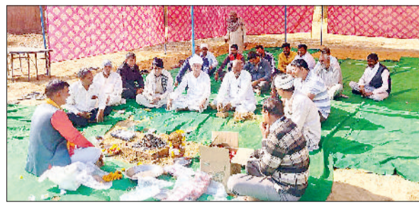
नांगल चौधरी। लॉजिस्टिक हब में धरना आरंभ करने से पहले हवन करते ग्रामीण।

कृषि अधिकारियों का मानना है कि एग्री स्टैक योजना से किसानों को डिजिटल पहचान, भूमि रिकॉर्ड, आय, ऋण और फसल की जानकारी का एक एकीकृत डेटाबेस मिलेगा, जिससे सरकारी योजनाओं (जैसे पीएम किसान, बीमा, ऋण) का सीधा और तेज लाभ, बेहतर कृषि सलाह, सटीक मौसम पूर्वानुमान और बाजार तक बेहतर पहुंच जैसे फायदे होंगे, जो पारदर्शिता और दक्षता बढ़ाते हुए शोखाथडी कम करते हैं। प्रदेश के सभी काश्तकार किसानों को एक डिजिटल मंच पर जोड़ना और उन्हें कृषि से संबंधित सुविधाओं का लाभ सरल एवं पारदर्शी रूप से उपलब्ध कराना है।