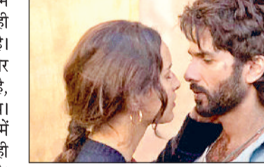
तृपति-शाहिद की रोमांटिक केमिस्ट्री शाहिद का रफ लव का लुक काफी जलवा है। वहीं एक झलक अविनाश तिवारी की भी दिखती है। हमेशा की तरह इस बार भी विशाल भारद्वाज की फिल्म में संगीत उन्हीं का है और गाने को लिखा गुलजार ने ही है। इस गाने को आवाज दी है प्यार का पर्याय बन चुके अरिजीत सिंह ने। गाना रोलो-रोमांटिक सॉन्ग है, जिसे आप सुनकर सुकून महसूस कर सकते हैं। विशाल भारद्वाज द्वारा निर्देशित 'ओ रोमियो' 13 फरवरी को वेलेंटाइन वीक में रिलीज होगी। फिल्म में शाहिद कपूर और तृपति डिमरी के अलावा एक बड़ी स्टारकास्ट नजर आएगी। इसमें नाना पाटेकर, विक्रम मेसी, अविनाश तिवारी, दिशा पाटनी, तन्विका माटिया और फरीदा जलाल जैसे सितारे शामिल हैं। पिछले दिनों फिल्म का टीजर जारी हुआ था, जिसे काफी पसंद किया गया। अब दर्शक फिल्म का बेसब्री से इंतजार कर रहे हैं।

मुंबई। शाहिद कपूर की आगामी फिल्म ओ रोमियो का पहला गाना 'हम तो तेरे ही लिए थे' शुक्रवार को रिलीज हो गया है। इसके साथ ही विशाल भारद्वाज और गुलजार की जोड़ी एक बार फिर लौटी है, वो भी अरिजीत सिंह की आवाज के साथ। पिछले दिनों रिलीज हुए फिल्म के टीजर में इस गाने की एक लाइन सुनने के बाद से ही फैस गाने का बेसब्री से इंतजार कर रहे थे। अब शुक्रवार को मेकर्स ने ये गाना रिलीज कर दिया है। गाने में तृपति डिमरी और शाहिद कपूर के बीच रोमांटिक केमिस्ट्री देखने को मिली है। ये जोड़ी पहली बार किसी फिल्म में साथ नजर आ रही है। लेकिन गाने में दोनों की केमिस्ट्री देखकर ऐसा लगता है कि ये जोड़ी दर्शकों को पसंद आ सकती है। गाने की शुरुआत में तृपति डिमरी का किरदार कहता है, 'कोई कैसे किसी से इतना प्यार कर सकता है?' गाने में प्यार, रोमांस, केयर और इमोशन सबकुछ देखने को मिलता है।