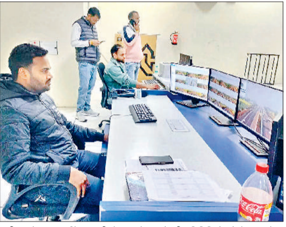
कनीना। नेशनल हाइवे 152 डी से गुजरते वाहनों की गतिविधियों को कंट्रोल करते हुए।

एनएच 152 डी पर भारी वाहनों के लिए 80 व हल्के वाहनों के लिए 100 किलोमीटर प्रति घंटे की गति निर्धारित