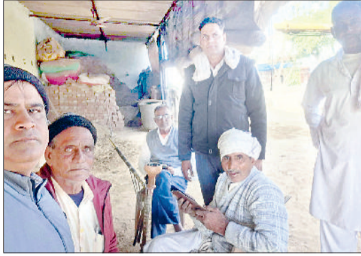
नारनौल। गांव में लगाए गए कैप में आईडी बनवाते किसान।

भविष्य में फसलों के लिए खाद भी इसी आईडी के आधार पर मिलेगा। इसलिए जो किसान एग्रीस्टैक आईडी बनवाने में आनाकानी कर रहे हैं, वह सचेत हो जाएं, क्योंकि उन्हें सरकारी योजनाओं के लाभ से हाथ धौना पड़ सकता है। इस योजना के आईडी बनवाने में जिला महेन्द्रगढ़ फिलहाल प्रदेश में टॉप पर बना हुआ है और जिला महेन्द्रगढ़ अब तक करीब 74500 किसानों ने