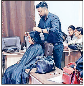
नारनौल। बालों की देखभाल के बारे में जानकारी देते विशेषज्ञ।